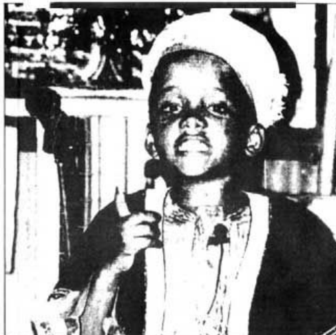
SCOTLAND on SUNDAY, AUGUST 8, 1999

В Кении столько сирот и маленького мальчика, привлечет никакого